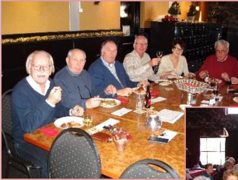
De deelnemers lieten zich de lunch goed smaken