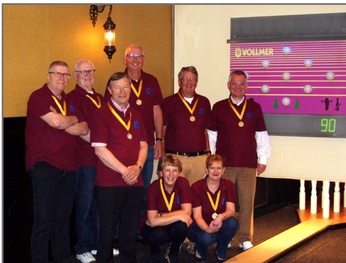
WBKB-team trotse kampioen van afdeling 3b in de derde divisie van de Landelijke competitie 2017-2018. De promotiewedstrijd voor een plaats in de tweede divisie is op zondag 3 juni in Brummen.